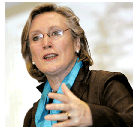
Mme Carolyn Bennett